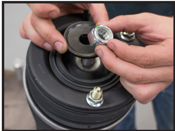
2003-2005, 2006-2012 ESCL. SUPERCOMPRESSO TELAIO L322

In base al modello di veicolo, esistono tre metodi possibili di rigenerazione dell'ammortizzatore Arnott. Prima di procedere alla rigenerazione, verificare il tipo di ammortizzatore ad aria sul quale si intende operare e individuare la soluzione idonea.