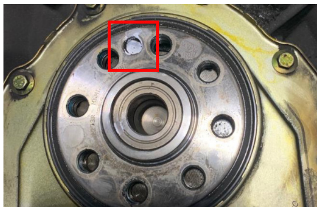
Figura 2: contrassegno di riferimento sull'albero motore

I volani a doppia massa sopra elencati presentano l'anello bersaglio per i sensori giri motore che rilevano la posizione dell'albero motore. Durante l'installazione, accertarsi che i contrassegni di riferimento sul DMF (foro piccolo, figura 1) siano allineati con quelli sull'albero motore (foro, figura 2). Se il DMF è installato nella posizione errata, non sarà possibile avviare il motore dopo la riparazione. Per evitare deformazioni e conseguenti vibrazioni del volano, è necessario installare le viti di fissaggio del DMF in una particolare sequenza. Innanzitutto tutte le viti devono essere avvitate manualmente, quindi serrate manualmente in una sequenza incrociata. Iniziare serrando la vite opposta al contrassegno di riferimento (foro piccolo, figura 1) alla coppia consigliata dal costruttore. Quindi, in senso orario, serrare le viti rimanenti alla stessa coppia.