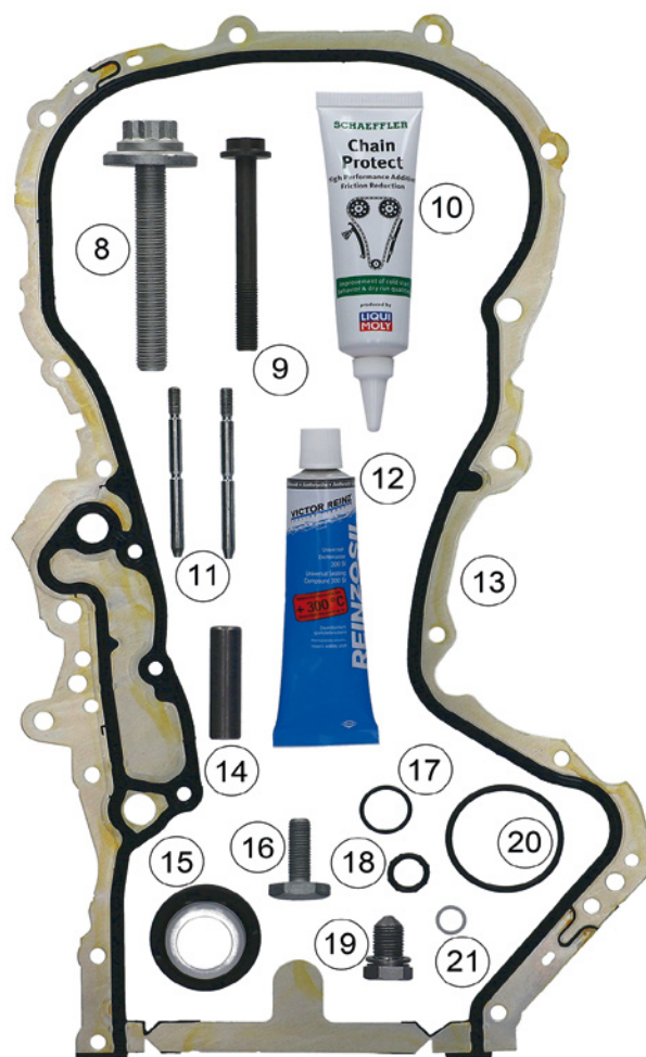
Photo 2 : 559 1808 40 / 559 1808 41 - Pièces jointes du kit de distribution par chaîne

Pour faciliter le montage, les deux kits de distribution par chaîne contiennent des tiges de guidage pour monter le boîtier de commande et le carter d'huile. Ces tiges se vissent dans la culasse ou le bloc-cylindres.