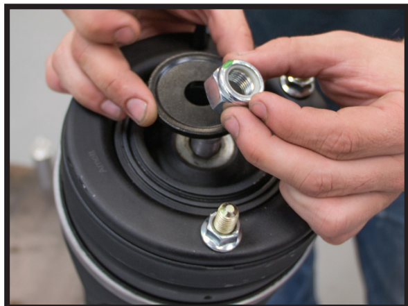
2003-2005, 2006-2012 EXC. SOBREALIMENTADO CHASIS L322

Dependiendo del modelo de vehículo, hay tres posibles métodos de composición para su puntal Arnott recompuesto. Antes de proceder con el proceso de composición, asegúrese de diferenciar qué puntal neumático está recomponiendo y seleccione la opción correcta.