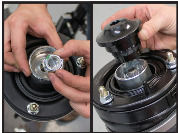
2006-2009 SOLO SOBREALIMENTADO

INSTALE LA ARANDELA NEGRA CON EL BORDE MIRANDO HACIA ARRIBA. A CONTINUACIÓN, INSTALE LA TUERCA Y APRIÉTELA.