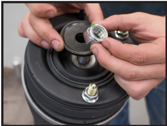
2003-2005, 2006-2012 ESCL. SUPERCOMPRESSO TELAIO L322

In base al modello di veicolo, esistono tre metodi possibili di rigenerazione dell'ammortizzatore Arnott. Prima di procedere alla rigenerazione, verificare il tipo di ammortizzatore ad aria sul quale si intende operare e individuare la soluzione idonea.