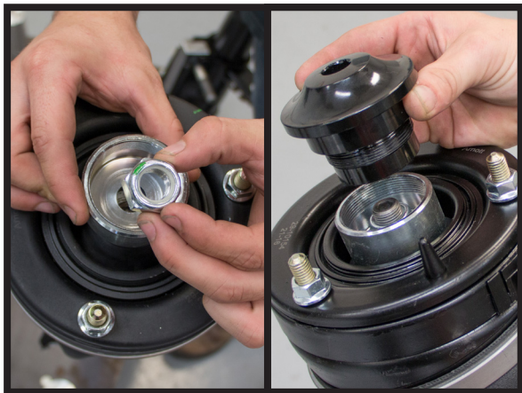
2006-2009 SOLO SUPERCOMPRESSO

MONTARE LA RONDELLA NERA CON IL LABBRO RIVOLTO VERSO L'ALTO. QUINDI, MONTARE IL DADO E SERRARLO.